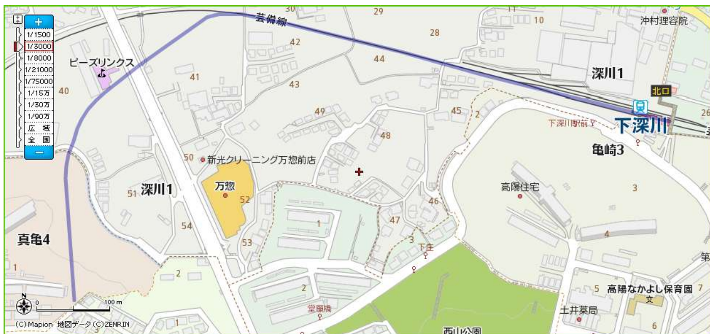
上地図の青線区間が新設単線を整備するルートである。

亀崎信号所～下深川駅間は、建設費を抑えるために芸備線を電化し、交換設備を増設する。これにより、列車の増発を可能にする。下深川駅～高陽NT中央駅間では単線電化路線として主に高架で1.0km整備する。