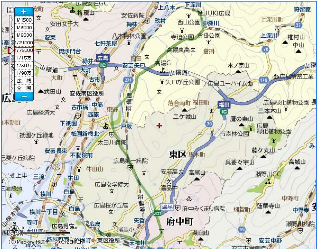
上地図の緑線区間が新規地下線を整備するルートである。

広島駅～下深川駅間では芸備線を地上設備として存続させるため、15.7km にわたる複線地下線を新たに整備する。ルートに関しても住宅地を經由するルートへと大幅変更をし、新駅を設置することにより乗客をとりこむ。下深川駅以北を走行する気動車の地下線乗り入れも検討されたが、排気ガスの問題などから地上線も存続させることにした。